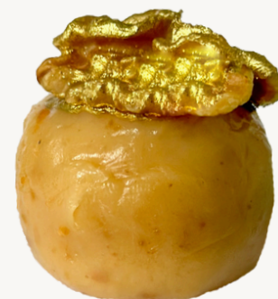
NOZES CAMELADO R$ 9,00