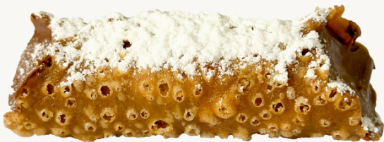
CANNOLI R$ 12,00