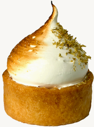
TORTINHA DE LIMÃO SICILIANO R$ 12,00