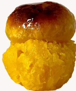
NINHO DE OVOS