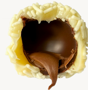
EXPLOSIVO NUTELLA R$ 7,00