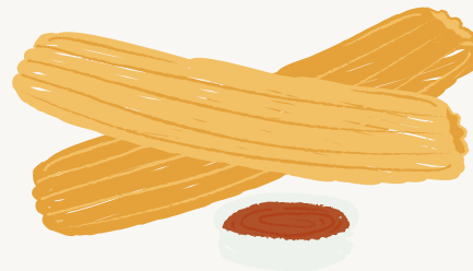
MINI CHURROS R$ 12,00