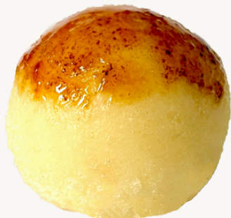
CRÈME BRÛLÉE R$ 7,00