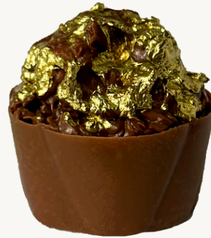
CROCANTE DE NUTELLA