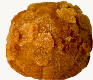
CARAMELO CROCANTE FEULLETINE