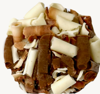
DOIS AMORES R$ 7,00