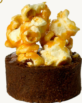
TORTINHA DE PIPOCA CAMELADA R$ 12,00