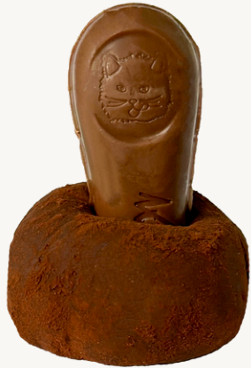
LÍNGUA DE GATO