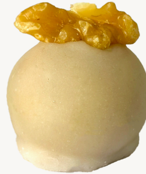
CAMAFEU DE NOZES