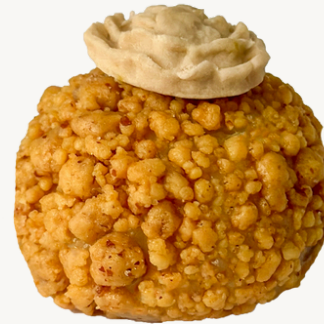
PAÇOQUINHA R$ 7,00