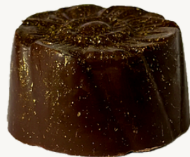
CARAMELO E FLOR DE SAL R$ 8,00