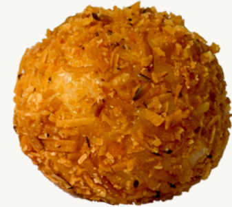
OURIÇO DE COCO