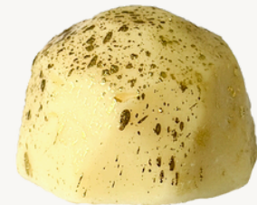
LIMÃO R$ 8,00