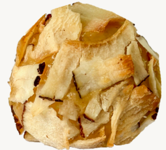
DOCE DE LEITE R$ 7,00