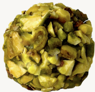
OURIÇO DE PISTACHE R$ 9,00