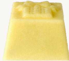
MARACUJÁ R$ 8,00