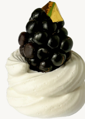
PAVLOVA R$ 12,00