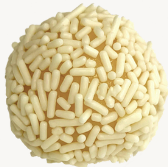
BRANCO R$ 7,00