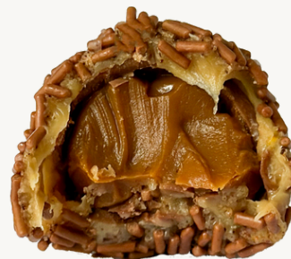
EXPLOSIVO DE DOCE DE LEITE