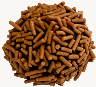
AO LEITE R$ 7,00