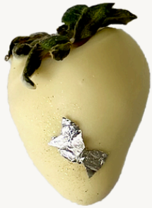
MORANGO R$ 8,00